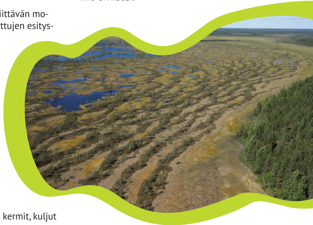
Kauhaneva ilmasta käsin.

Retken jälkeen koulussa: Pohtikaa yhdessä, mikä oli retken parasta antia. Millaisia uusia asioita opitte? Mikä ryhmätyöesitys oli erityisen mieleenpainuva? Miltä metsä ja suo tuoksuvat ja kuulostivat? Miksi Suomessa on paljon soita? Mitä hyötyä soista on?