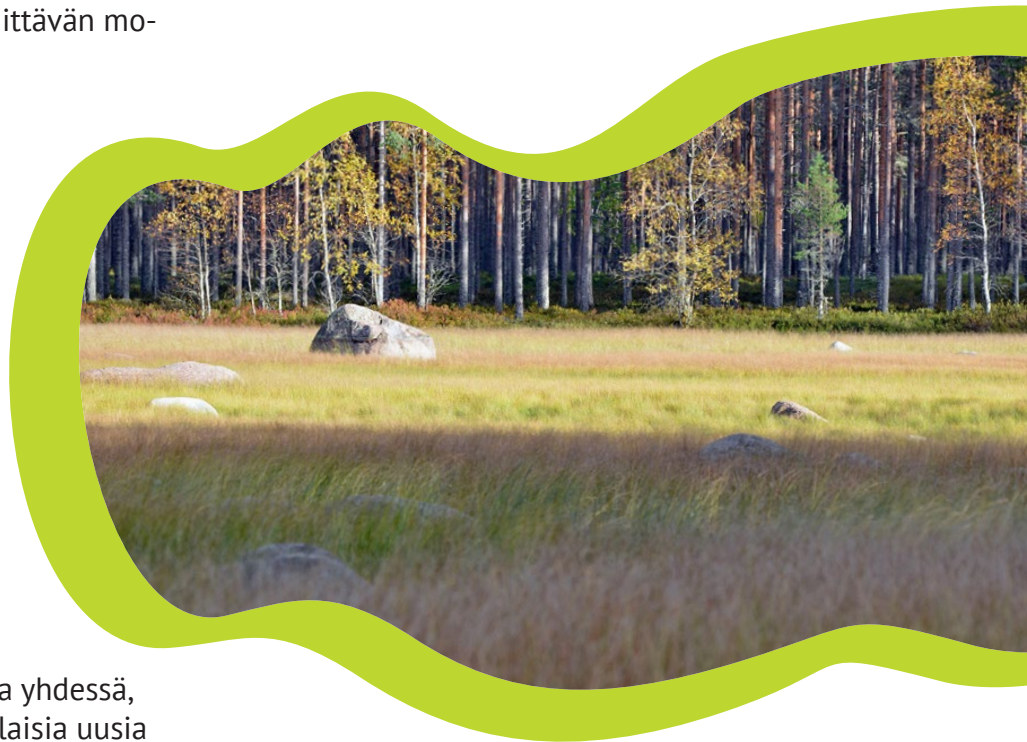
Kuivajärvi syksyllä.

Retken jälkeen koulussa: Pohtikaa yhdessä, mikä oli retken parasta antia. Millaisia uusia asioita opitte? Mikä ryhmätyöesitys oli erityisen mieleenpainuva? Miltä metsä tuoksui ja kuulosti? Millaiset eläinlajit erityisesti hyötyvät kausikosteikoista? Mihin tervaa on ennen käytetty ja tarvittu suuria määriä?