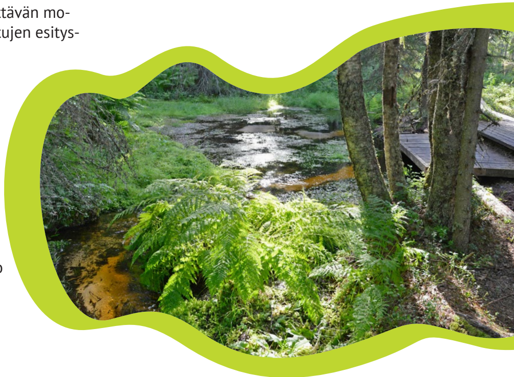
Peräkorven lähde.

Retken jälkeen koulussa: Pohtikaa yhdessä, mikä oli retken parasta antia. Millaisia uusia asioita opitte? Mikä ryhmätyöesitys oli erityisen mieleenpainuva? Miltä metsä ja suo tuoksuvat ja kuulostivat?